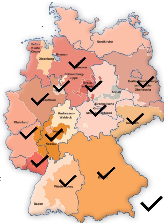
Abbildung 2: Landeskirchliche Erprobungs- bzw. Innovationsprogramme

Aber es lassen sich auch Projektionen beobachten, bei denen man die offenen Themen der kirchlichen Gesamtorganisation auf die Erprobungsräume überträgt – wie z.B. die Frage der alternativen Finanzierung jenseits von Kirchensteuer und Zuweisungssystem – und sie mit Erwartungen im Blick auf die gesamtkirchliche Zukunft auflädt.